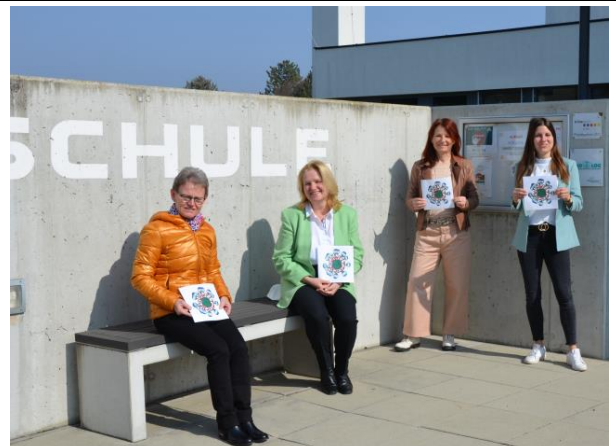
Der Lehrkörper der Volksschule ist stolz auf das verliehene Umweltzeichen.

Besonders stolz sind wir aber auf das Umweltzeichen, welches unserer Volksschule kürzlich erst vom Umweltministerium verliehen wurde. Es ist eine Auszeichnung, die bislang nur wenige Schulen haben und wofür besondere Kriterien zu erfüllen sind: hohes Umweltengagement, nachhaltige und soziale Schulentwicklung, biologische, regionale Ernährung und Gesundheitsförderung.