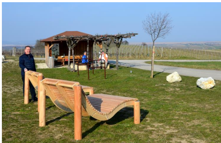
Nicht nur die Pergola und der Rastplatzunterstand sollen zum Verweilen und zum Genießen des herrlichen Ausblicks auf den Neusiedler See einladen. Man kann es sich auch auf Relaxliegen gemütlich machen.

Gemeindeübergreifend wurden Wanderwege festgelegt, die an Marterl und Sehenswürdigkeiten vorbeiführen, Wegweiser und Infotafeln aufgestellt, die Marterl entsprechend mit Beschreibungen auf Standpulten versehen. In Schützen am Gebirge wurden im Rahmen dieses Projektes im Jahr 2019 und 2020 Bildstöcke restauriert, bei der Pergola am Sinner wurde ein Rastplatzunterstand errichtet und am oberen Goldberg eine Aussichtsplattform errichtet. Dazu kommen noch Ausstattungen wie Sitzgarnituren (Hl. Antonius am Tiergartenweg), Radständer, Papierkörbe, Relaxliegen usw. Faltkarten werden an alle Haushalte ergehen, sobald sie uns vorliegen.