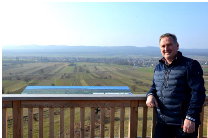
Auf der Brüstung der Aussichtsplattform wurden Panoramatafeln angebracht, auf denen die nähere und weitere Umgebung genau beschrieben ist.

Ich darf Sie einladen, die Wege entlangzuwandern und dabei über unsere Gemeinde und ihre Umgebung mehr zu erfahren. Besuchen Sie als Höhepunkte die Aussichtsplattform mit Blick auf unser Dorf und den Rastplatz, wo Ihnen das Panorama des Neusiedler Sees zu Füßen liegt.