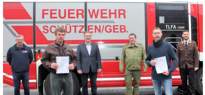
Nach der Wahlversammlung wurde den Gewählten zur Wahl gratuliert und Urkunden überreicht.

Ich gratuliere den Gewählten und wünsche ihnen und der Feuerwehr alles Gute!