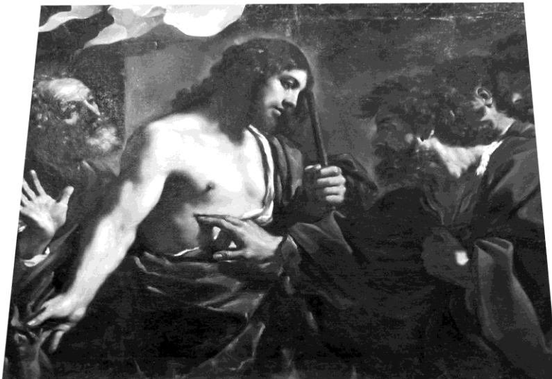
Guercino (1591-1666), Die Ungläubigkeit des heiligen Thomas, 1621

Die Feuerwehr und alle Mitfeiernden werden gebeten um 08.45 Uhr in der Kirche zu sein.