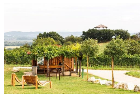
Rastplatz Goldberg, Laube (2008) Überdachung (2019), Relaxliegen (2021)