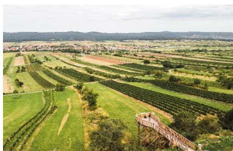
Aussichtsplattform errichtet 2020