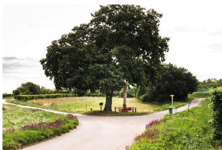
Dreifaltigkeitssäule zuletzt renoviert 2020

Die Strecke (Rundwanderweg Schützen-Süd) führt vom Dorfplatz über die Hauptstraße und die Ruster Straße zur Dreifaltigkeitssäule , weiter zur Aussichtsplattform , von dort über den Wandersteig auf den Goldberg und weiter zum Rastplatz Goldberg , wo die Gemeinde zu einem abschließenden Umtrunk mit Imbiss einlädt.